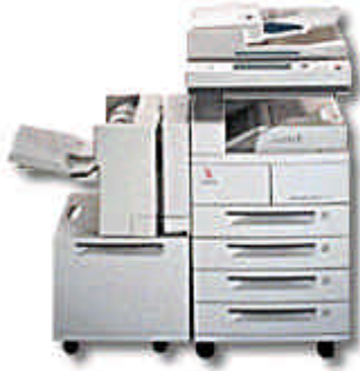
DC 220, 230 ST DC 332, 340 ST DC 265 ST